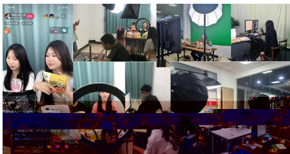
图 组织学生开展实习实训