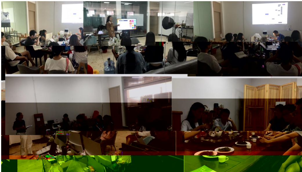
图 特邀企业专家来基地为学生进行专业培训

地 2023 地 ( 2), 供 宝贵的 。 过 的分 , 度 、 场变 , 对电 播 的 。 不 的 储备, 高 操 , 的 发 奠定 础。 措 合 的 度, 地 合 的 。