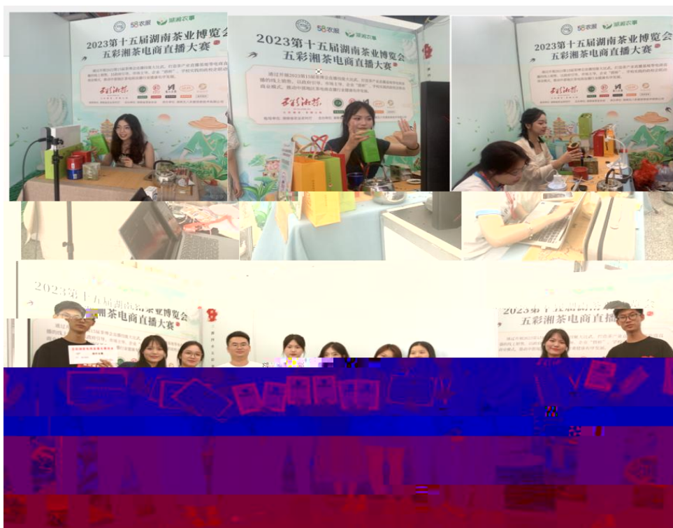
图 “湖南省第十五届茶博会” 电商直播比赛现场

播和方的，短的 得的步。 队比10多单、单， 包但不、等多个，的 和队得的高度。的 得不对公的，更对参 付出和的充分定。