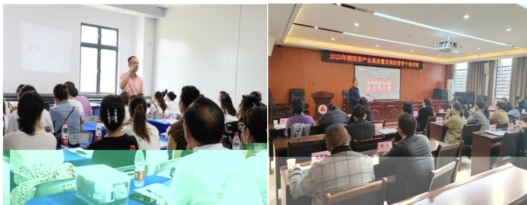
图 企业协助学校为湘西茶企开展电商直播培训

更 对 电 的 。 过 的 ， 茶 得 更 地 电 播的操 、 策 等方 的 ， 电 的 奠定 础。